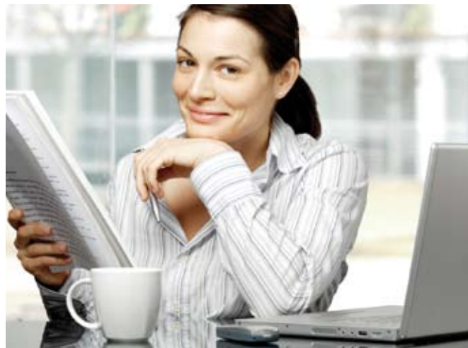
Anlass zur Freude gibt das häusliche Arbeitszimmer nur noch selten

Entscheidend für die Anerkennung eines häuslichen Arbeitszimmers ist, wo die qualitative Hauptleistung des Berufstätigen erbracht wird. Der quantitative Umfang, also wie viel er zu Hause arbeitet, spielt nur in Grenzfällen eine Rolle. Wer nun glaubt, damit sei der eigenen Interpretation Tür und Tor geöffnet, liegt falsch. Bei der Entscheidung kommt es nicht auf die subjektiven Vorstellungen des Steuerpflichtigen an, sondern allein darauf, wie die Verkehrsanschauung einen bestimmten Beruf würdigt. Einige Beispiele können das veranschaulichen: