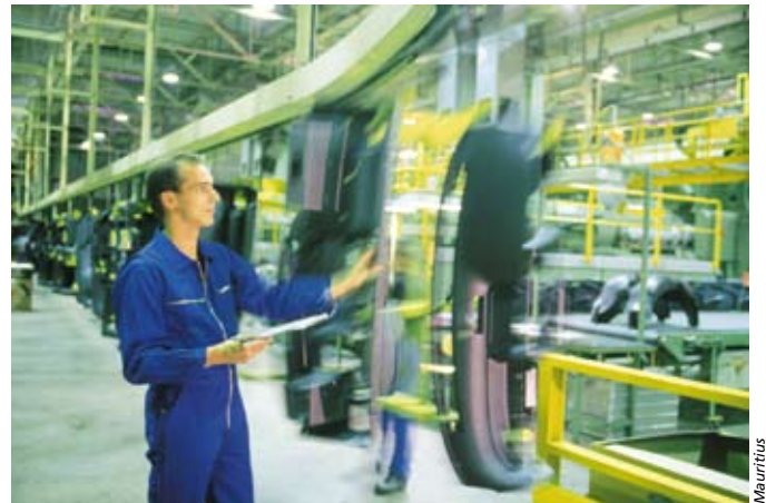
Besonders große Unternehmen werden von der Reform profitieren

Die Hinzurechnung erfolgt ab 2008 allerdings nur, wenn ein Viertel der Summe der Korrekturposten den Freibetrag von 100.000 Euro übersteigt. Dazu zählen alle Zinsen, drei Viertel des Betrags, der für Immobilien-Mietzinsen ausgegeben wurde und 20 % der Mieten für bewegliche Güter wie etwa Leasing-Autos oder Maschinen.