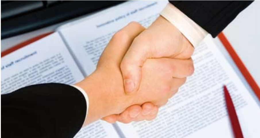
Mit einem Handschlag ist es bei GmbH-Gründungen längst nicht mehr getan