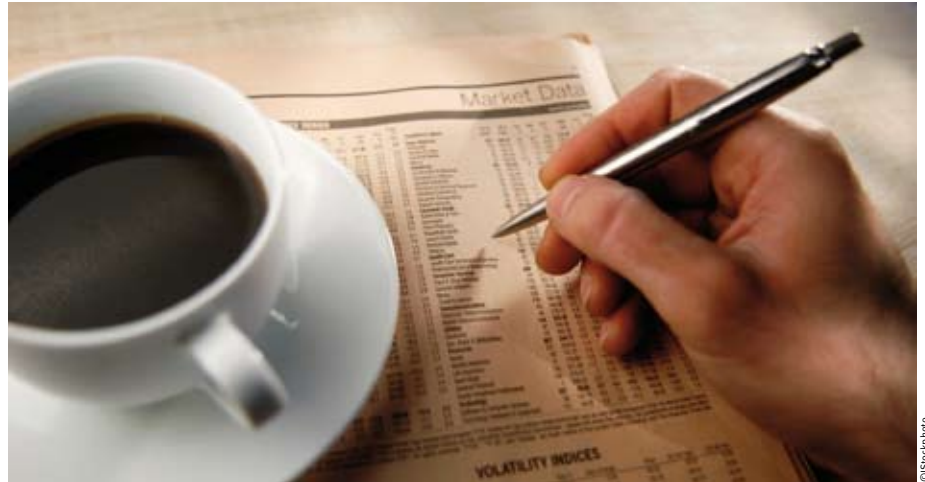
Aktienverluste sind ärgerlich, aber steuerlich verrechenbar

Generell sind Wertpapierverluste nur innerhalb der Bereiche Kapitalvermögen sowie Spekulationsgewinne verrechenbar. Ein Ausgleich mit anderen Einkünften ist nicht möglich.