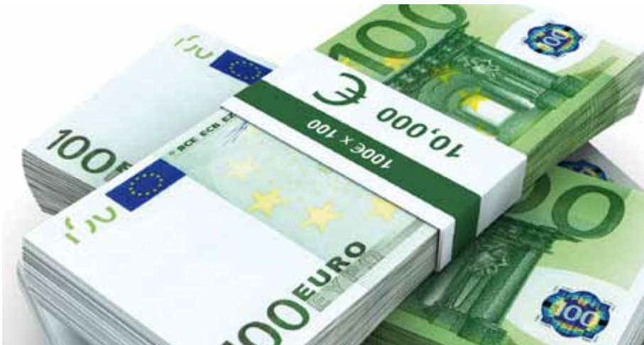
Mit mehreren Milliarden Euro wird die Bundesregierung dieses Jahr die Konjunktur stützen.