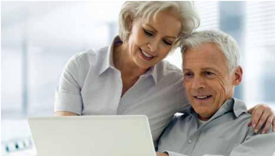
So unbeschwert können Rentner beim Thema Steuern nicht mehr sein